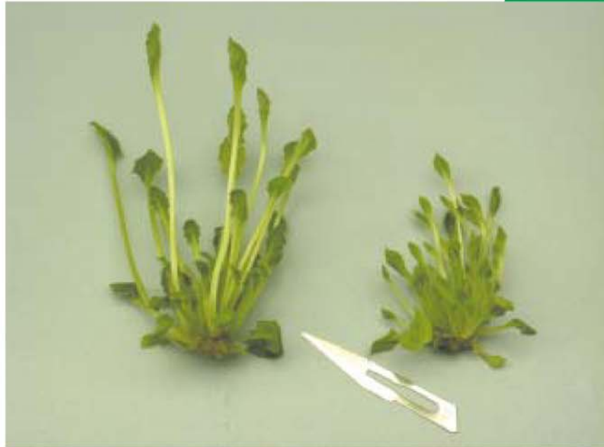
Gérbera – Esquerda: tetraplóide – direita: diplóide

A criação de plantas ocorre por meio do cruzamento (hibridização) e da seleção. O criador visa unir as boas características de 2 plantas diferentes em sua prole por hibridização. Ele visa selecionar a prole de plantas que mostra a melhor combinação de qualidades de ambas as plantas-mãe. Esse processo depende inteiramente da produção da prole: em outras palavras, a formação de semente viável. O criador tem um problema se nenhuma semente for formada. Esse problema pode, às vezes, ser resolvido dobrando o número de cromossomos de uma das plantas-mãe.